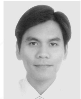
Pukiringan Palivulung 童信智

我…… 滿懷心意，歸返故鄉 回到我生長的地方 我…… 滿懷理想，不再流浪 決定永久留家鄉