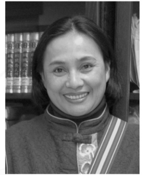
Ljumeq · Patadalj 蔡愛蓮

但隔夜清晨 傷口因長出嫩芽而痊癒 攀附包裹撞擊的石頭 長出嫩芽結出新枝 使樹更茂盛